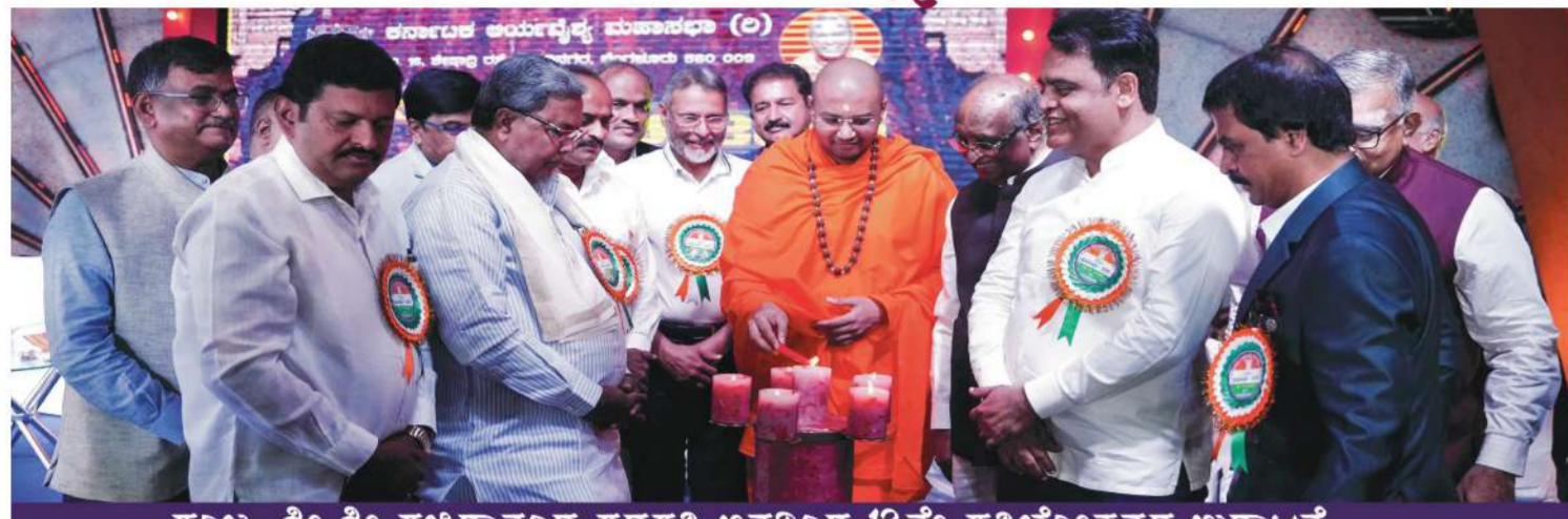
ಪೂಜ್ಯ ಶ್ರೀ ಶ್ರೀ ಶ್ರೀಧರಾನಂದ ಶರಣ್ವತಿ ಅವರಿಂದ 12ನೇ ಪ್ರತಿಭೋತ್ಸವದ ಉದ್ಘಾಟನೆ

ಕರ್ನಾಟಕ ಅರ್ಯವೈಶ್ಯ ಮಹಾಸಭೆಯ 12ನೇ ಪ್ರತಿಭೋತ್ಸವ ಕಾರ್ಯಕ್ರಮವು ಕರ್ನಾಟಕದ ರಾಜಧಾನಿ ಬೆಂಗಳೂರು ನಗರದ ಅರಮನೆ ಮೈದಾನದ ತ್ರಿಪುರವಾಸಿನಿಯಲ್ಲಿ ಅತ್ಯಂತ ವರ್ಣರಂಜಿತ ಮತ್ತು ವೈಭವದಿಂದ ಕೂಡಿದ್ದ ಭವ್ಯ ವೇದಿಕೆಯಲ್ಲಿ ನಡೆಯಿತು. ನಾಡಿನ ಅರ್ಯವೈಶ್ಯ ಸಮಾಜದ ಮನದಲ್ಲಿ ಚಿರಕಾಲ ನೆನಪಿನಂಗಳದಲ್ಲಿ ಉಳಿಯುವಂತೆ ಮಾಡಿತು. ಇದು ಸಮಾಜದ ಶೈಕ್ಷಣಿಕ ಪ್ರತಿಭೆಗಳ ಸಾಧನೆಯನ್ನು ಪ್ರಶಂಸಿಸುವ ಮೂಲಕ ಅವರಲ್ಲಿ ಸ್ಪೂರ್ತಿಯನ್ನು ತುಂಬಿ ಮುಂದಿನ ಉಜ್ವಲ ಭವಿಷ್ಯವನ್ನು ರೂಪಿಸಿಕೊಳ್ಳಲು ಪ್ರೇರಣಾ ಶಕ್ತಿಯಾಯಿತು. 2022ನೇ ಸಾಲಿನ ಪ್ರತಿಭೋತ್ಸವಕ್ಕೆ 2019 ಅರ್ಜಿಗಳು ಬಂದಿದ್ದು, ಅದರಲ್ಲಿ 1508 ಅರ್ಜಿಗಳನ್ನು ಅಂಗೀಕರಿಸಲಾಗಿದ್ದು, ವರ್ಷದಿಂದ ವರ್ಷಕ್ಕೆ ನಮ್ಮ ಅರ್ಯವೈಶ್ಯ ಸಮಾಜದ ಶೈಕ್ಷಣಿಕ ಕ್ಷೇತ್ರದ ಸಾಧನೆಯು ಏರುಗತಿಯಲ್ಲಿ ಸಾಧಿಸುತ್ತಿರುವುದಕ್ಕೆ ಈ ವರ್ಷದ ಸಾಧನೆಯೇ ಸಾಕ್ಷಿಯಾಗಿದೆ.