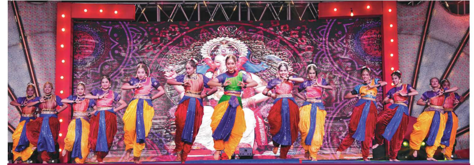
ಹೆಚ್ಚಿನಾಡ ಮಂಗಳೂರು ತಂಡದಿಂದ ನಾಂಸ್ವೃತಿಕ ಕಾರ್ಯಕ್ರಮಗಳು