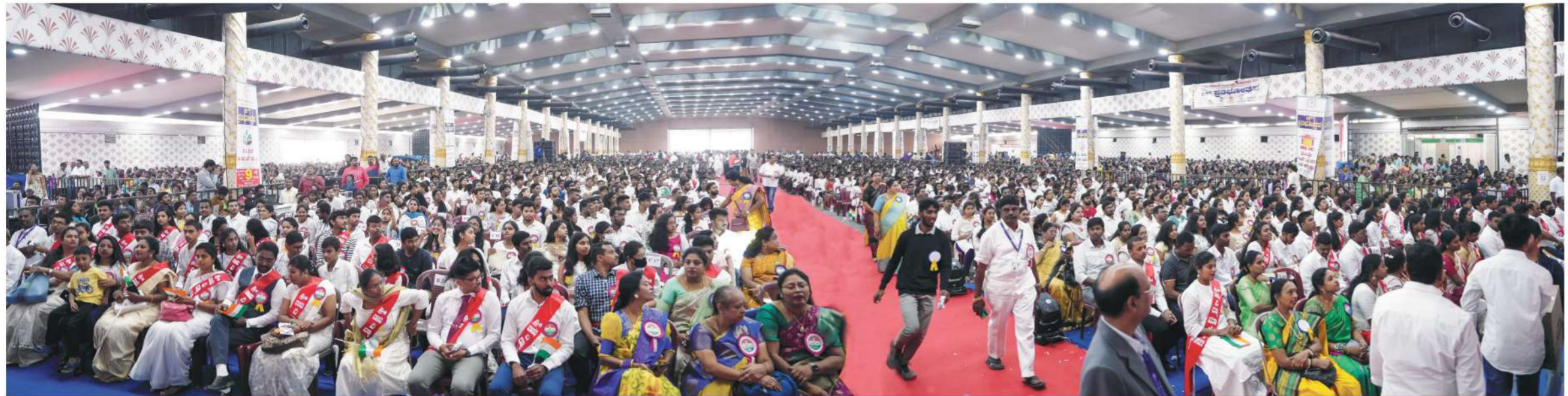
12ನೇ ಪ್ರತಿಭೋತ್ಸವಕ್ಕೆ ಆಗಮಿಸಿದ್ದ ಅಪಾರ ಜನಸಂಖ್ಯೆ